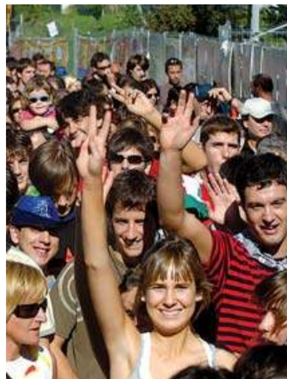
Jóvenes esperando al inicio de un concierto.