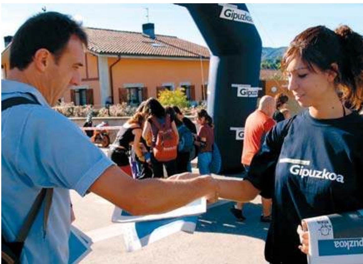
NOTICIAS DE GIPUZKOA repartió un suplemento especial sobre la fiesta del euskera.

NOTICIAS DE GIPUZKOA también quiso estar presente en Oiartzun, pero no fue con las manos vacías. Tres personas se encargaron de repartir un suplemento especial de 24 páginas sobre el Kilometroak.