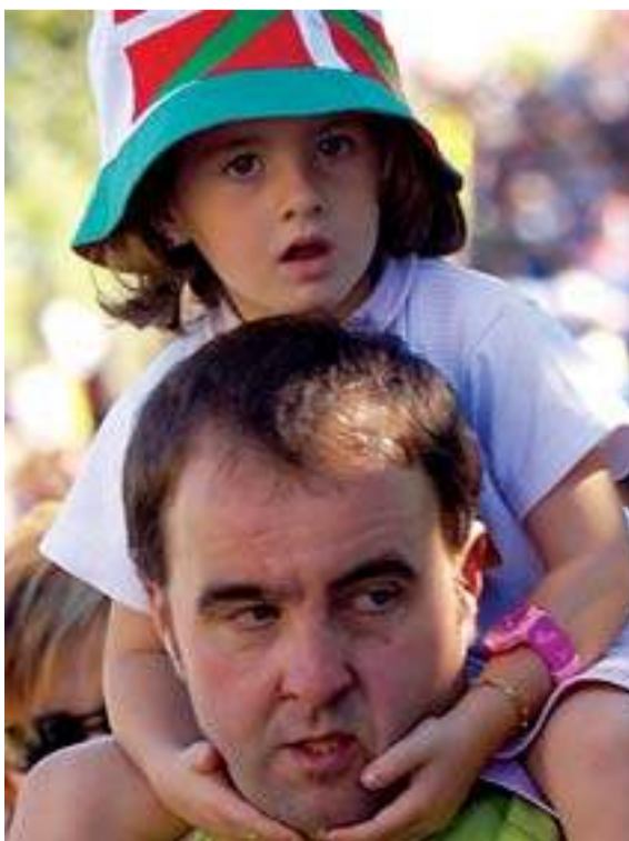
Un pequeño descanso después de tanto andar.