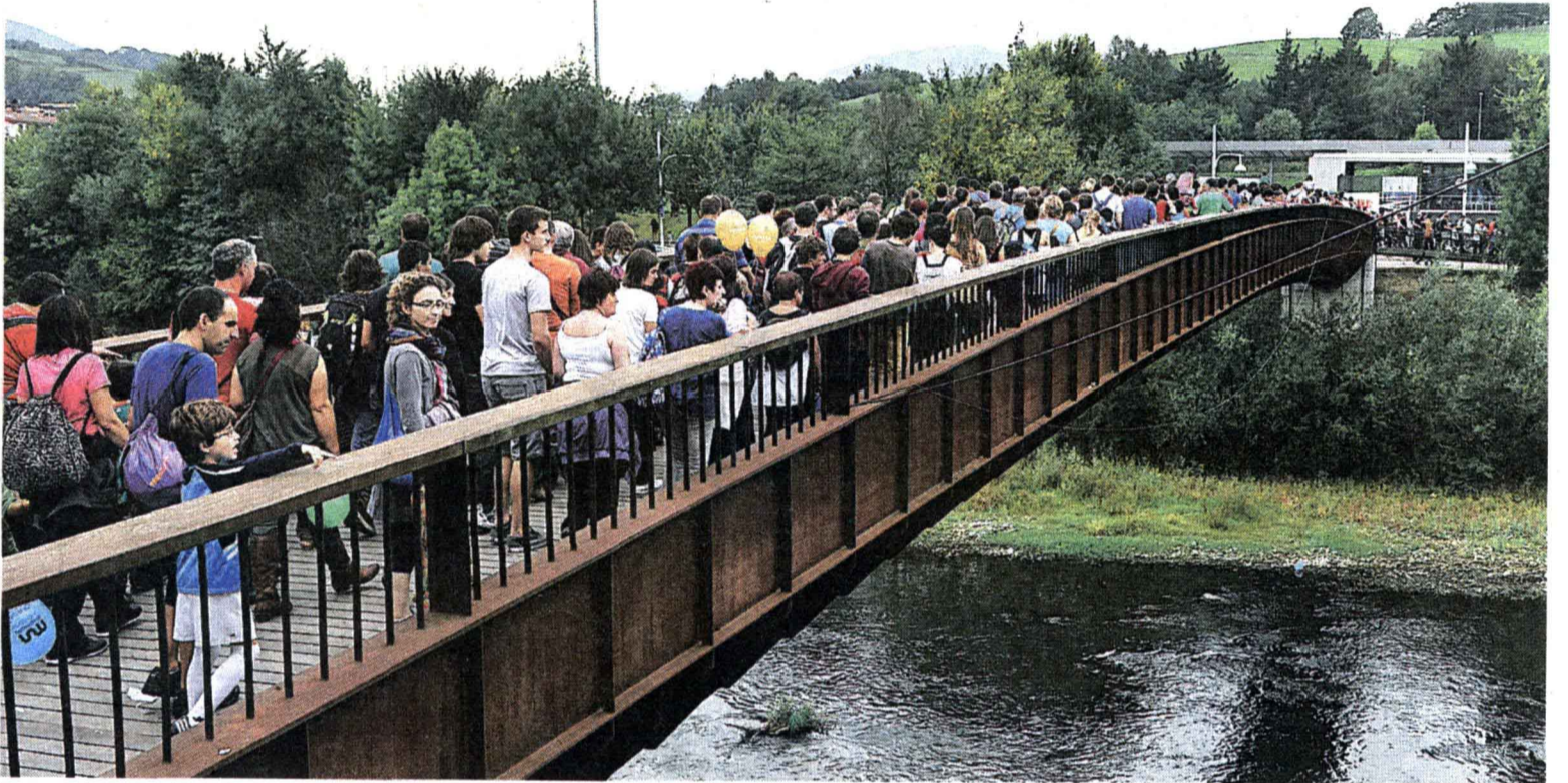
Txandaka. Jendetza zela eta, zubi gaineko denak beste muturrera heldu arte ez zitzaien paso ematen zain zeudenei.