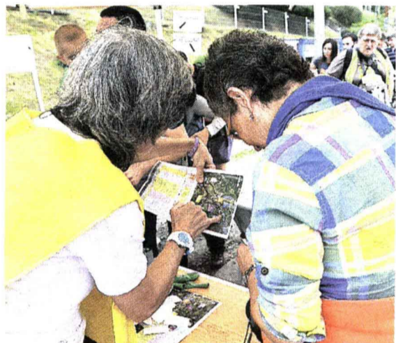
Una voluntaria explica el recorrido.

Vea el vídeo escaneando con su móvil este código QR