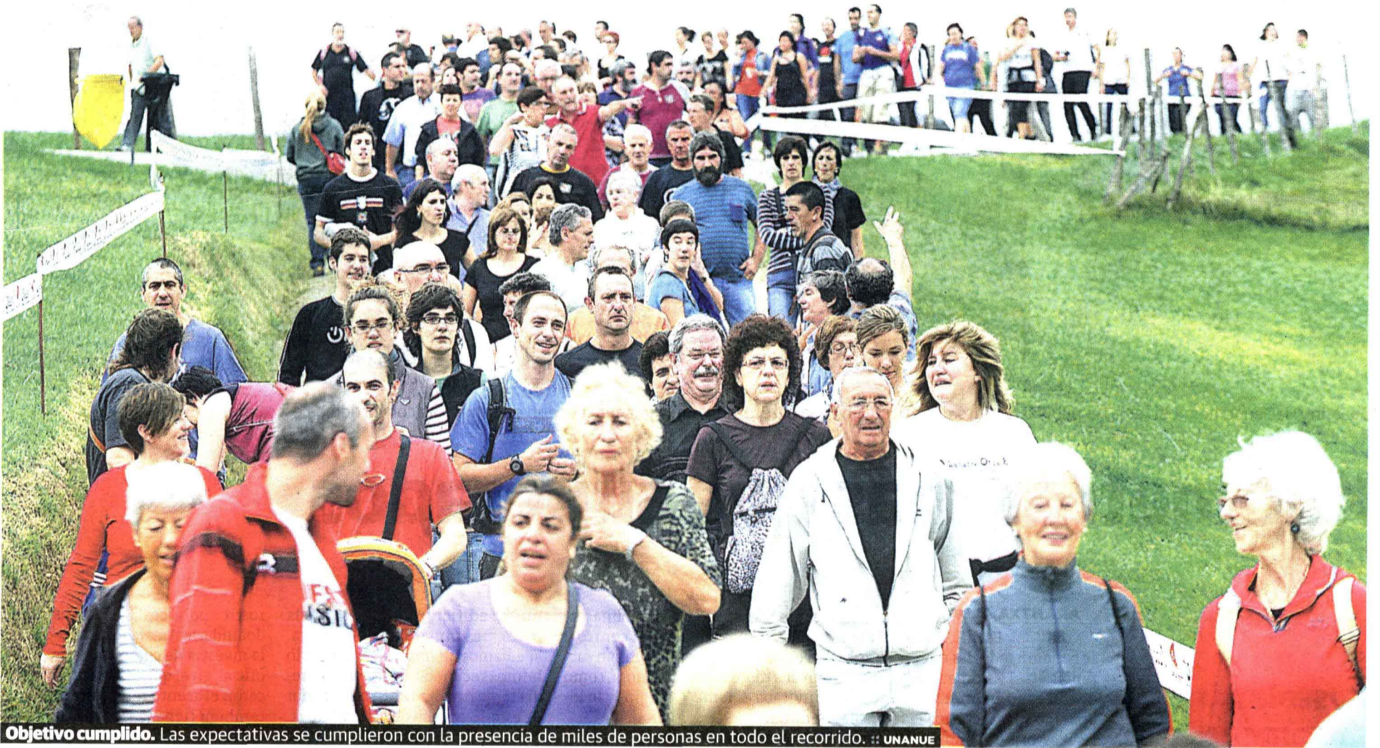
Objetivo cumplido. Las expectativas se cumplieron con la presencia de miles de personas en todo el recorrido. :: UNANUE

Miles de personas se unieron a la fiesta del euskera y acudieron a Andoain, en apoyo a la ikastola Aita Larramendi. P2