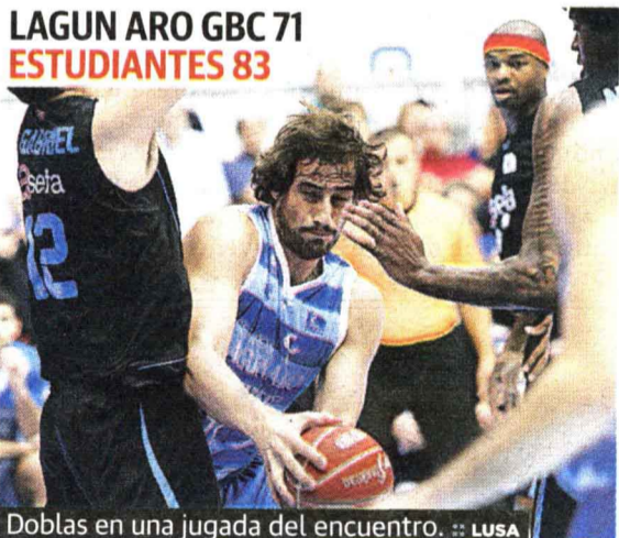
Doblas en una jugada del encuentro.