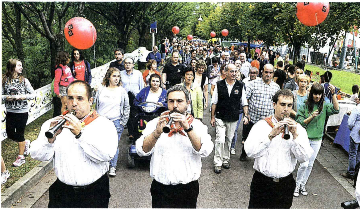
Madrugadores. Los representantes políticos y de la ikastola abrieron paso en el recorrido.