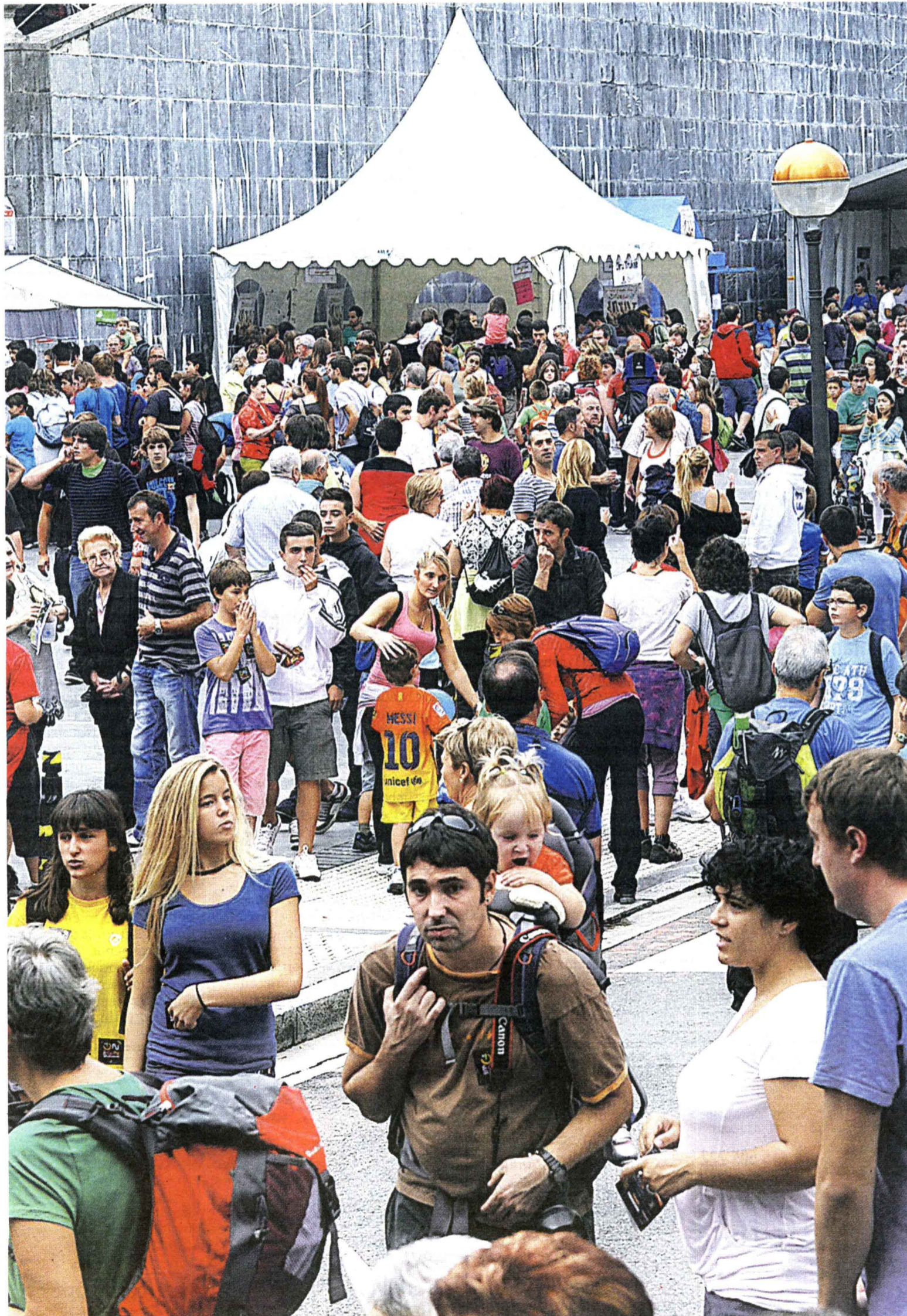
Goikoplaza. Ibilbideko zati handi bat oso urbanoa zenez, herriko gune zabaletara hedatu zen Kilometroetako giroa.

Kilometroak bizitzeko era asko izan ziren, baina denek ekarri zioten zerbait arrakastari