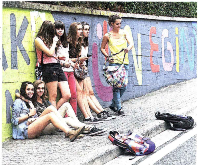
Atsedendia. Ibilbidearen albo batean, nora jo pentsatuz edo...