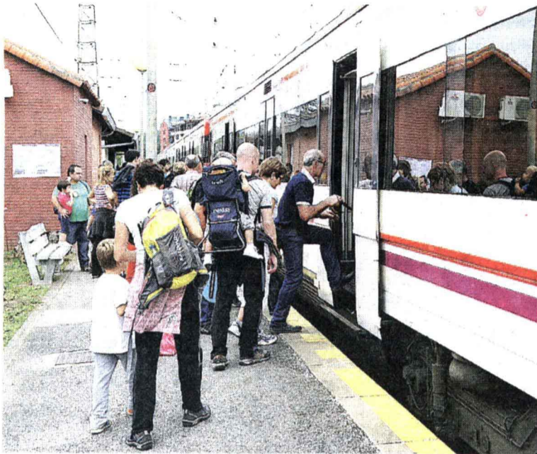
Trena. Etengabeko joan-etorrian eman zuten eguna trenek.

Gazte horiek elikatu zuen batak bat Kilometroen luzapen birtuala. Nork bere konexioa edo ibilbideko hainbat puntutan egokitu zen wifi konexio irekia baliatuz (herriarentzat geldituko da gaurtik aurrera), gogotik bidali zituzten argazkiak eta mezuak, sare sozialen bitartez uneoro emanez ibilbidean barrena gertatzen zenaren berri. Azken batean, bakoitzak bere ekarpena egin zion arrakastari. Emaizta, eta hori da garrantzitsuen, elkartasun eta atxikimendu adierazpen erraldoia izan zen.