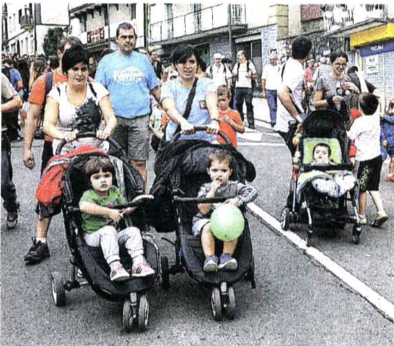
Los coches que más se vieron fueron los de niño.