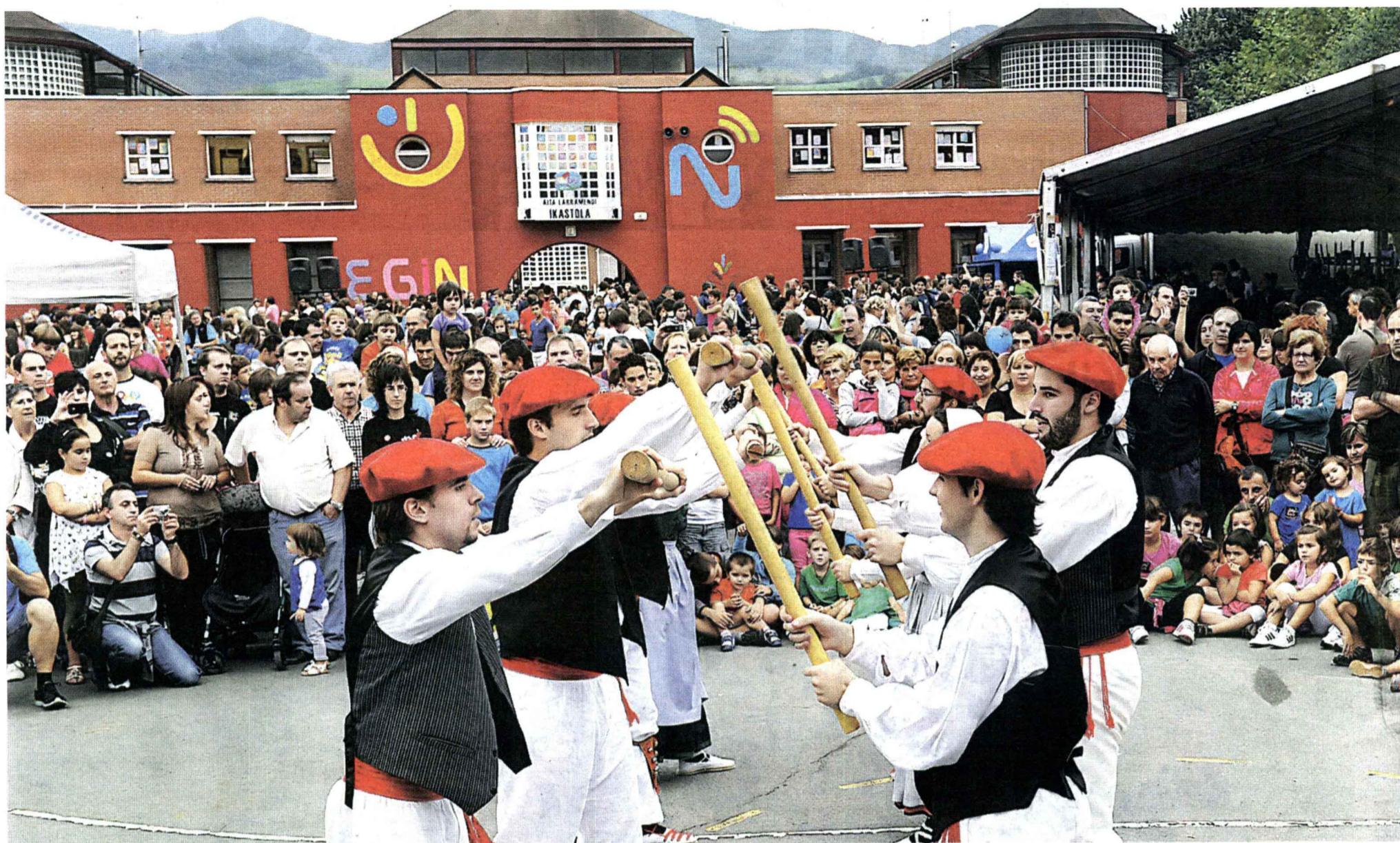
'On Egin'. Haciendo honor al lema, el público disfrutó de la fiesta en todo el recorrido. En la imagen, el patio de la ikastola convertido en escenario.