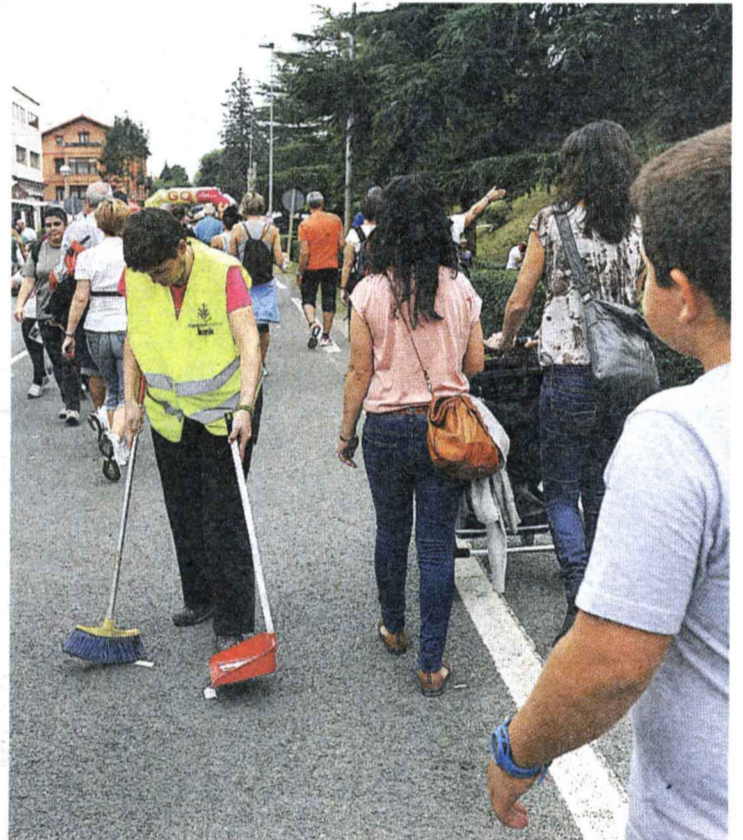
▲ Lan eskerga. Kale garbiketan, postuak atentitzen, txoznetan, sarrerak eta ibilbideko puntu gorabeheratsuak zaintzen, segurtasunean... Lan bikaina egin zuten antolakuntzako 1.500 kideek.