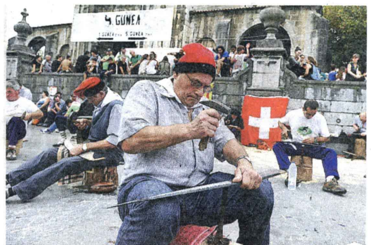
▲ Sega pikatzen. Euskal Herria eta Suitza segan lehiatu ziren lehenik Sorabillan, eta sega pikatzen ere aritu ziren norgehiago-ka Goikoplazan, Almitza Sega Elkartearen eskutik.