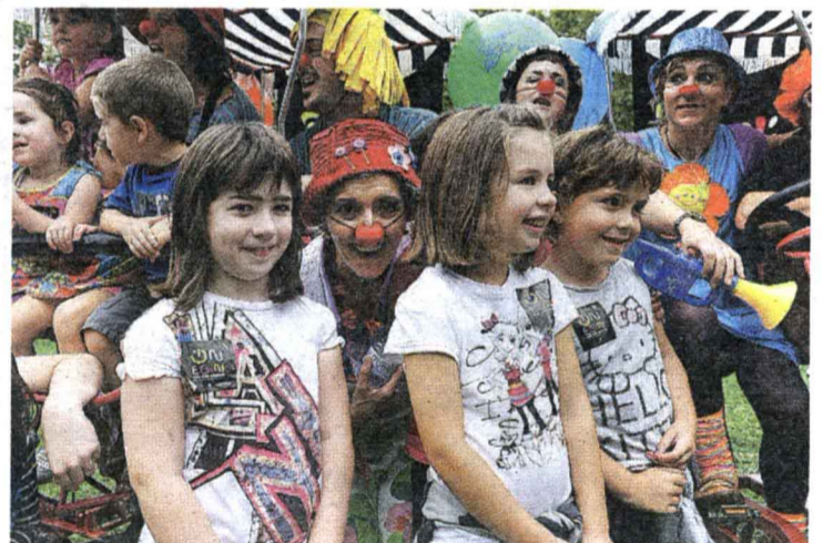
▲ Haurren gunea. Gune guztietan zeuden haurrentzako jarduerak, baina Etxeberrietakoan, batez ere Irrien Lagunen gunean, beraiek ziren jaun/andere eta jabe.

Kilometro denak bat eta bera direla esaten duten arren, bakoitzak uzten du bere arrastoa Gipuzkoako ikastolen jaien kate luzean. Jatorrizko ezaugarri eta xedeei eutsiz, etengabe berritzen dakien festak oso goian jarri zuen muga atzokoan Andoainen. Gaurtik aurrera, tolosarrei dagokie hurrengo urratsa egitea.