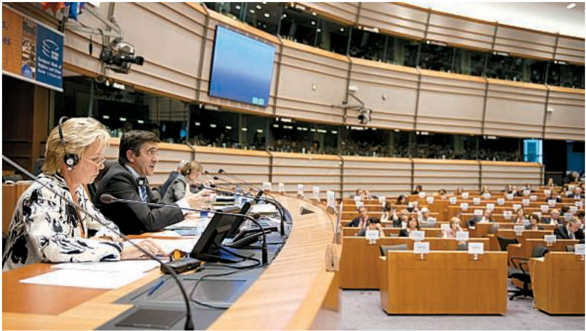
Patxi Lopez Eusko Jaurlaritzako lehendakariak Eskualdeen Batzordean hitz egin zuen atzo.

Euskal Autonomia Erkidegoak krisialdi ekonomikotik irteteko dituen erronkak hizpide izan zituen Lopezek osoko bilkuran. Hala, bestelako eredu ekonomikoa martxan jartzea ez ezik, «herrialde eredu berria» eraikitzeko oinarriak ipintzea ezinbestekoa dela esan zuen. Eredu berri hori eraiki ahal izateko, Europako eskualdeetako esperientziei erreparatzea ezinbestekotzat jo zuen.